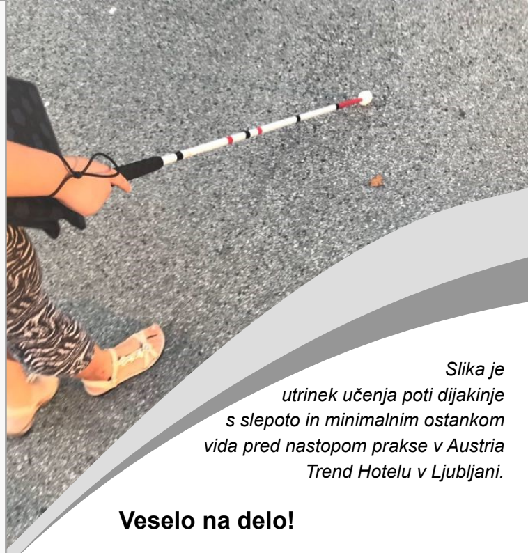
Slika je utrinek učenja poti dijakinje s slepoto in minimalnim ostankom vida pred nastopom prakse v Austria Trend Hotelu v Ljubljani.

"Manjka nam takšnih informacij in znanja. Počutim se veliko bolj pripravljeno na delo s slepimi in slabovidnimi."